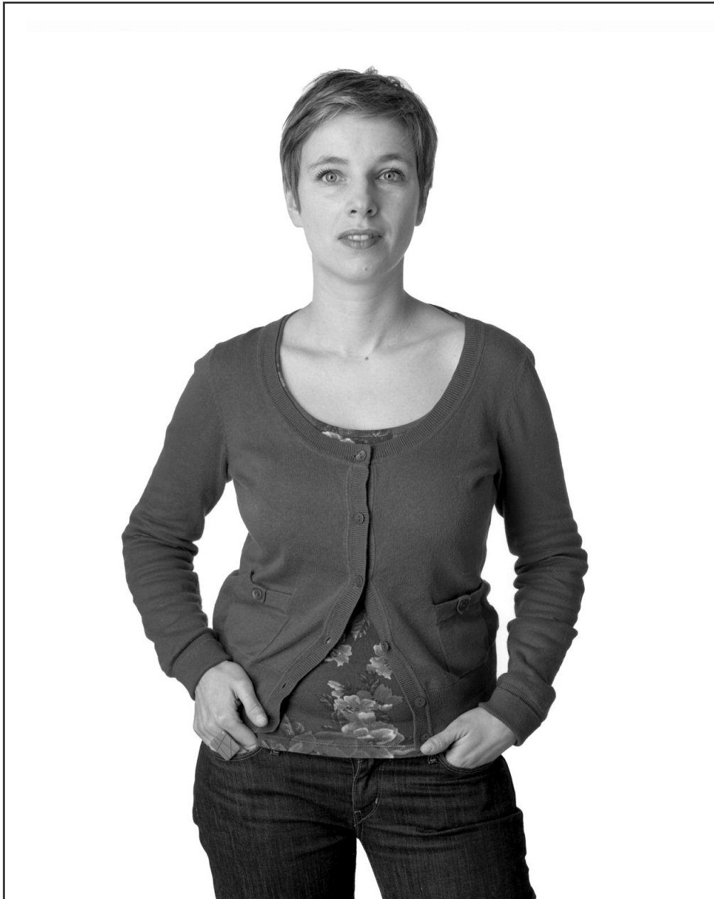
Clémentine Autain, Féministe, directrice du mensuel Regards

Parce que l'idéal de la femme blanche, séduisante mais pas pute, bien mariée mais pas effacée, travaillant mais sans trop réussir, pour ne pas écraser son homme, mince mais pas névrosée par la nourriture, restant indéfiniment jeune sans se faire défigurer par les chirurgiens de l'esthétique, maman épanouie mais pas accaparée par les couches et les devoirs d'école, bonne maîtresse de maison mais pas bonniche traditionnelle, cultivée mais moins qu'un homme, cette femme blanche heureuse qu'on nous brandit tout le temps sous le nez, celle à laquelle on devrait faire l'effort de ressembler, à part qu'elle a l'air de beaucoup s'emmerder pour pas grand-chose, de toute façon je ne l'ai jamais croisée, nulle part. Je crois bien qu'elle n'existe pas.