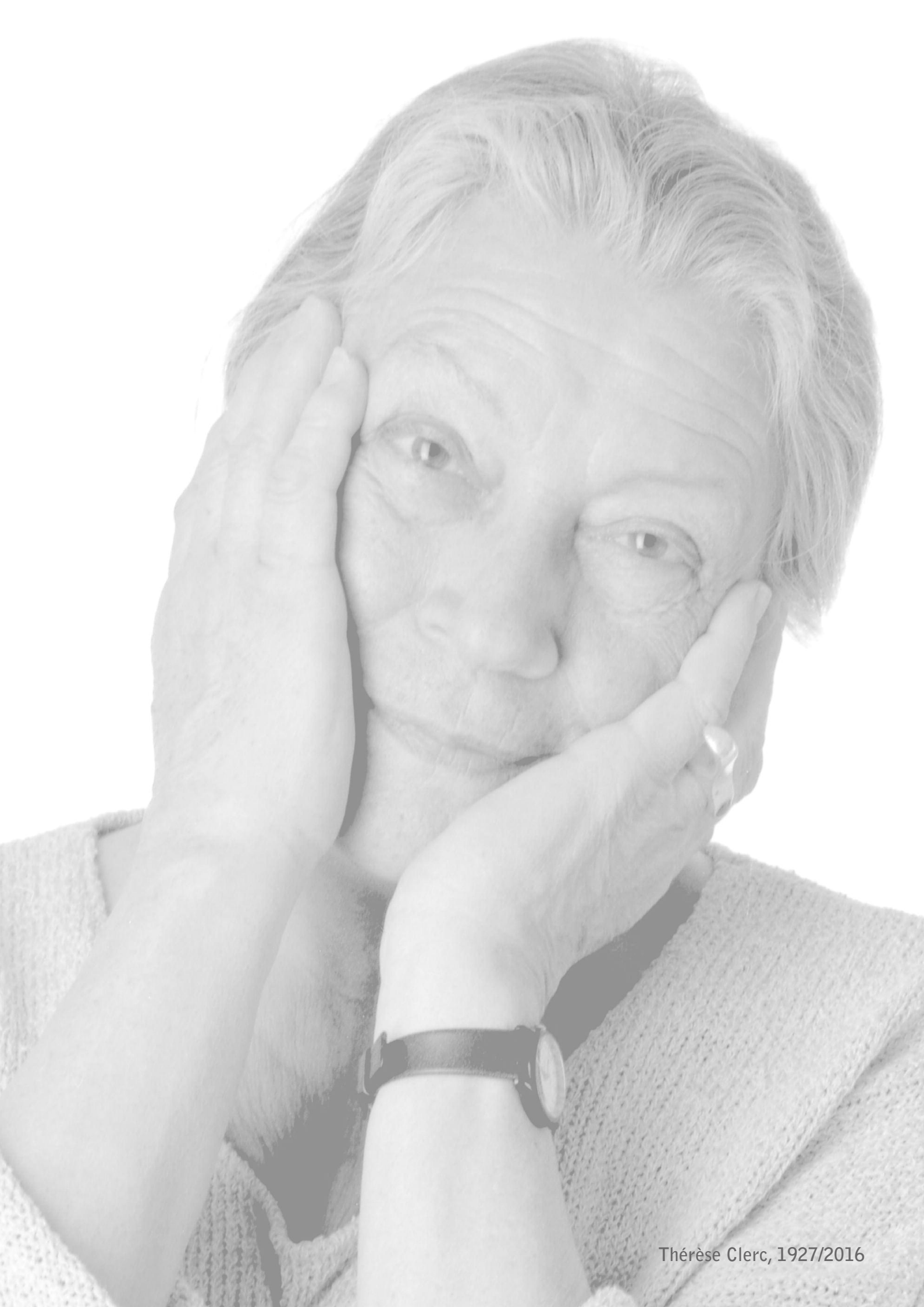
Thérèse Clerc, 1927/2016